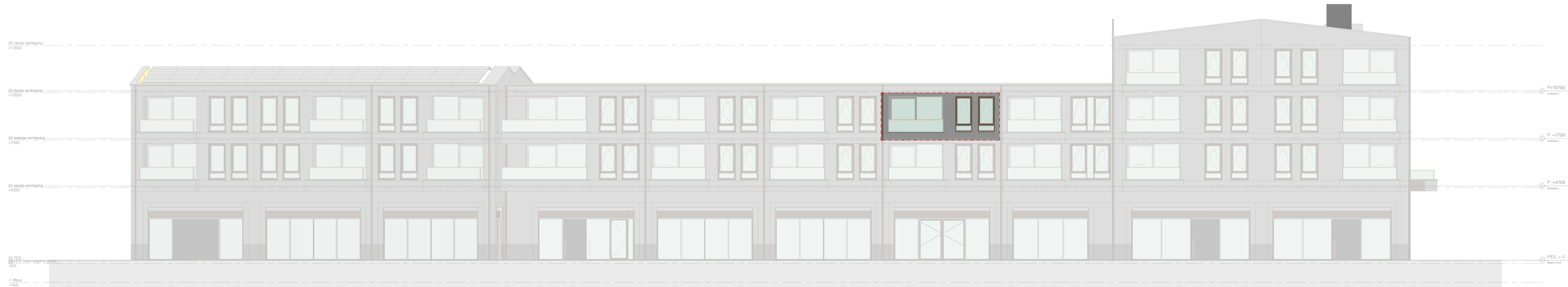
zijgevel links - Appartement 23