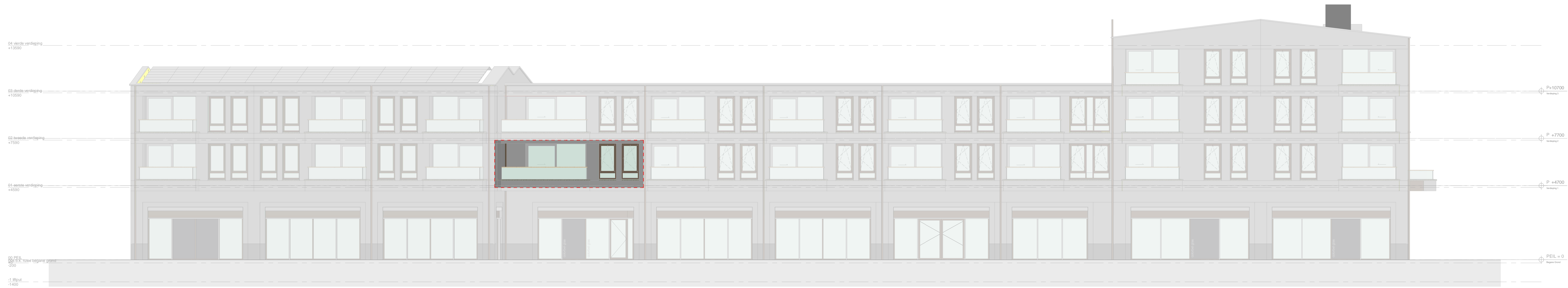
zijgevel links - Appartement 7