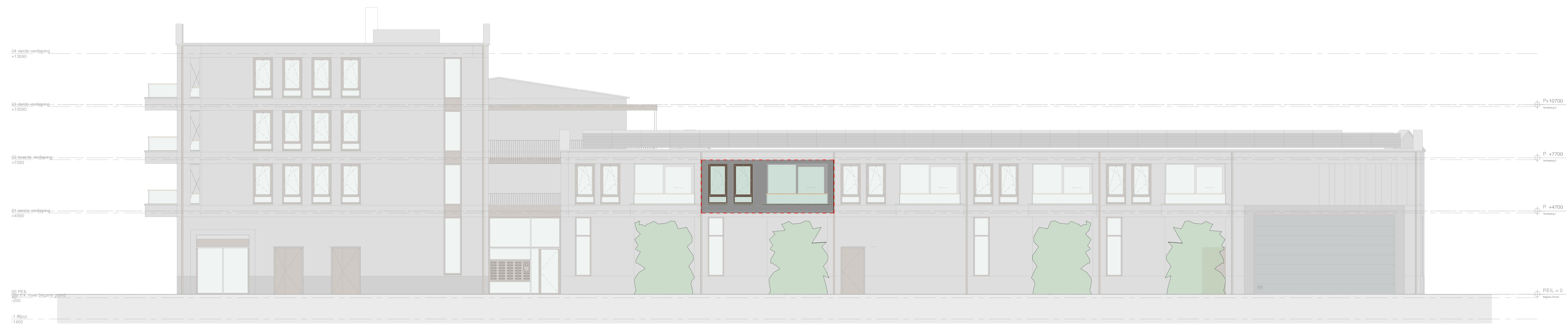
voorgevel - Appartement 18