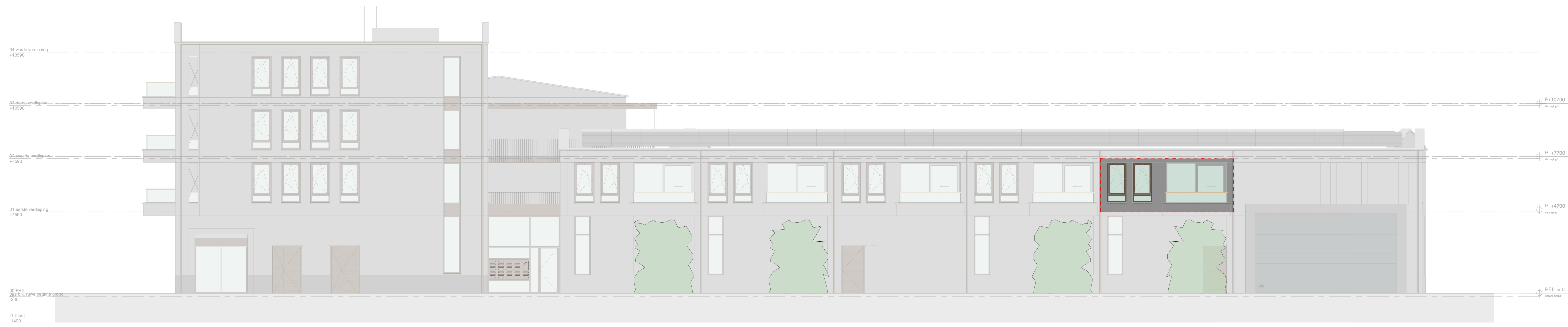
voorgevel - Appartement 15